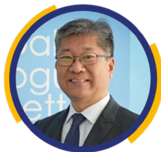
Young Tae Kim Sekretarz Generalny Międzynarodowego Forum Transportowego ITF