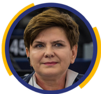
Beata Szydło Posłanka do Parlamentu Europejskiego