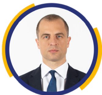
amb. Tomasz Szatkowski Stały Przedstawiciel RP przy Radzie Północnoatlantycznej NATO