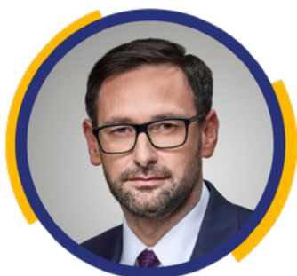
Daniel Obajtek Prezes Zarządu, Dyrektor Generalny, PKN ORLEN