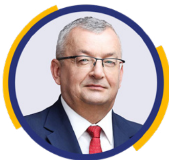
Andrzej Adamczyk Minister Infrastruktury