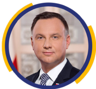
Andrzej Duda Prezydent Rzeczypospolitej Polskiej