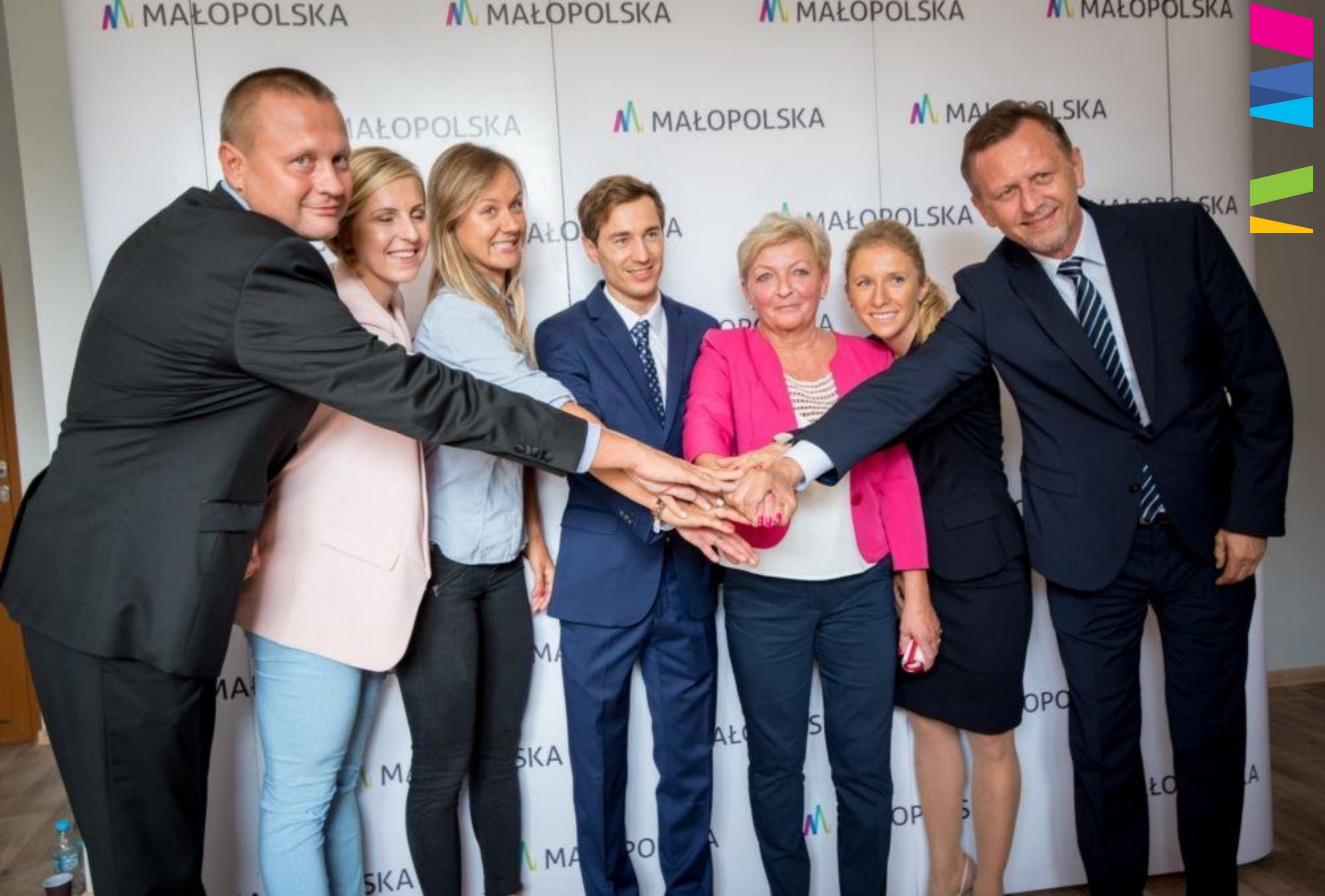
OTWARCIE NOWOCZESNEJ HALI W SMS W ZAKOPANEM