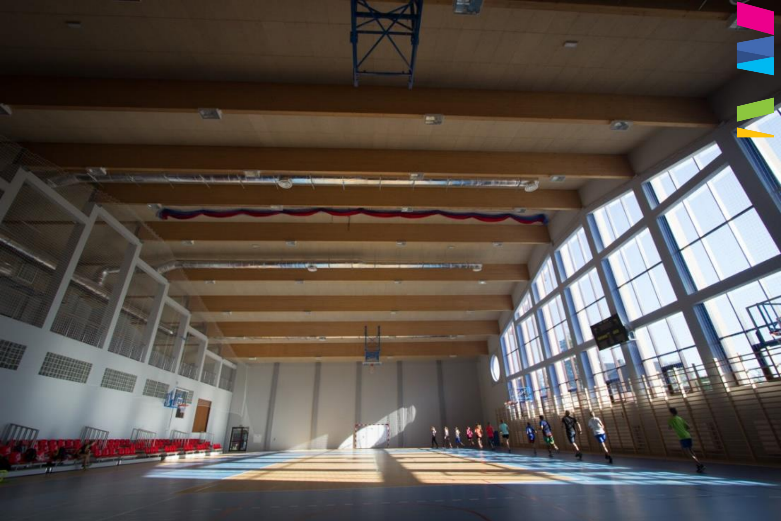
NOWOCZESNA HALA W SMS W ZAKOPANEM