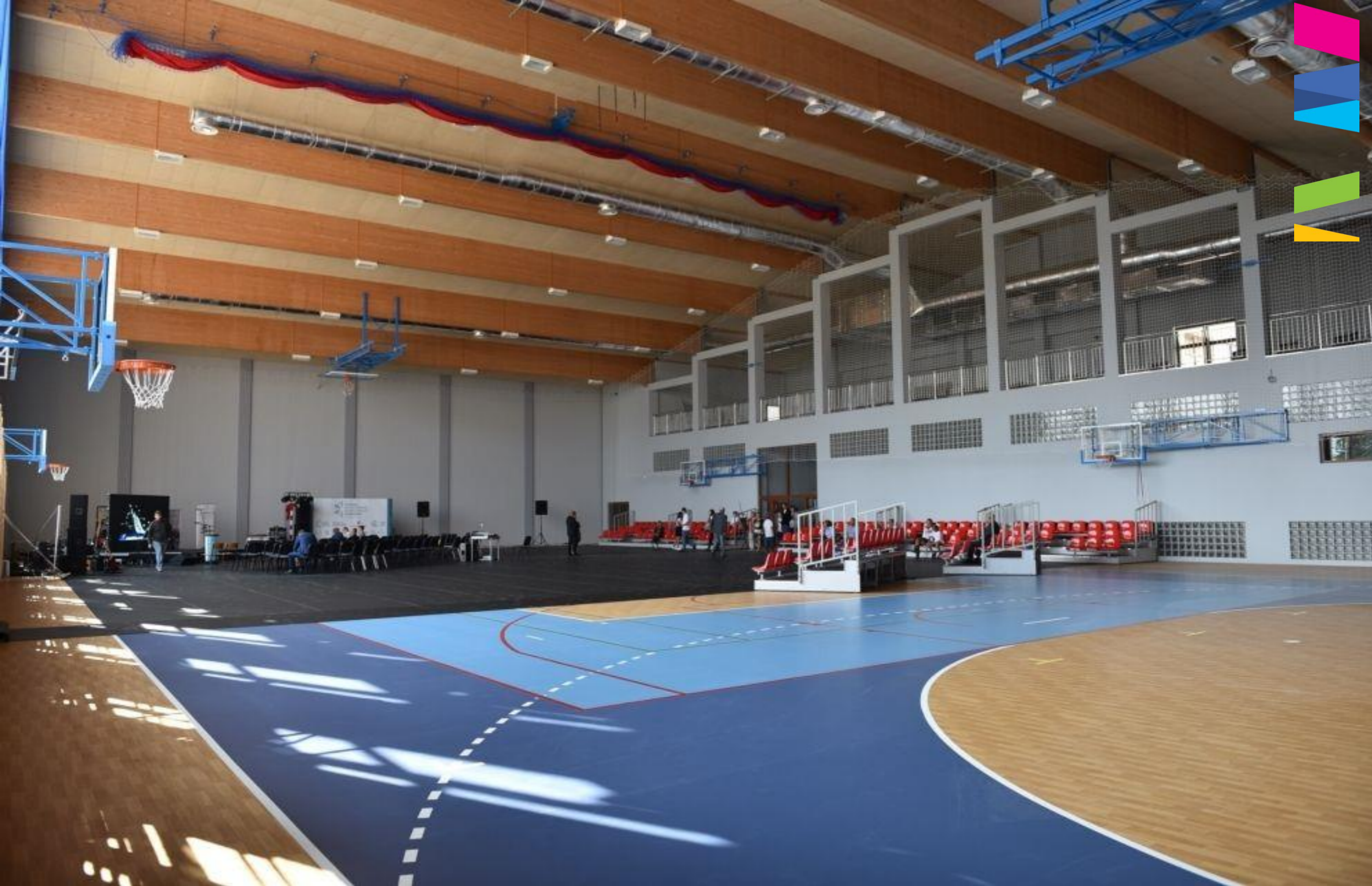
NOWOCZESNA HALA W SMS W ZAKOPANEM