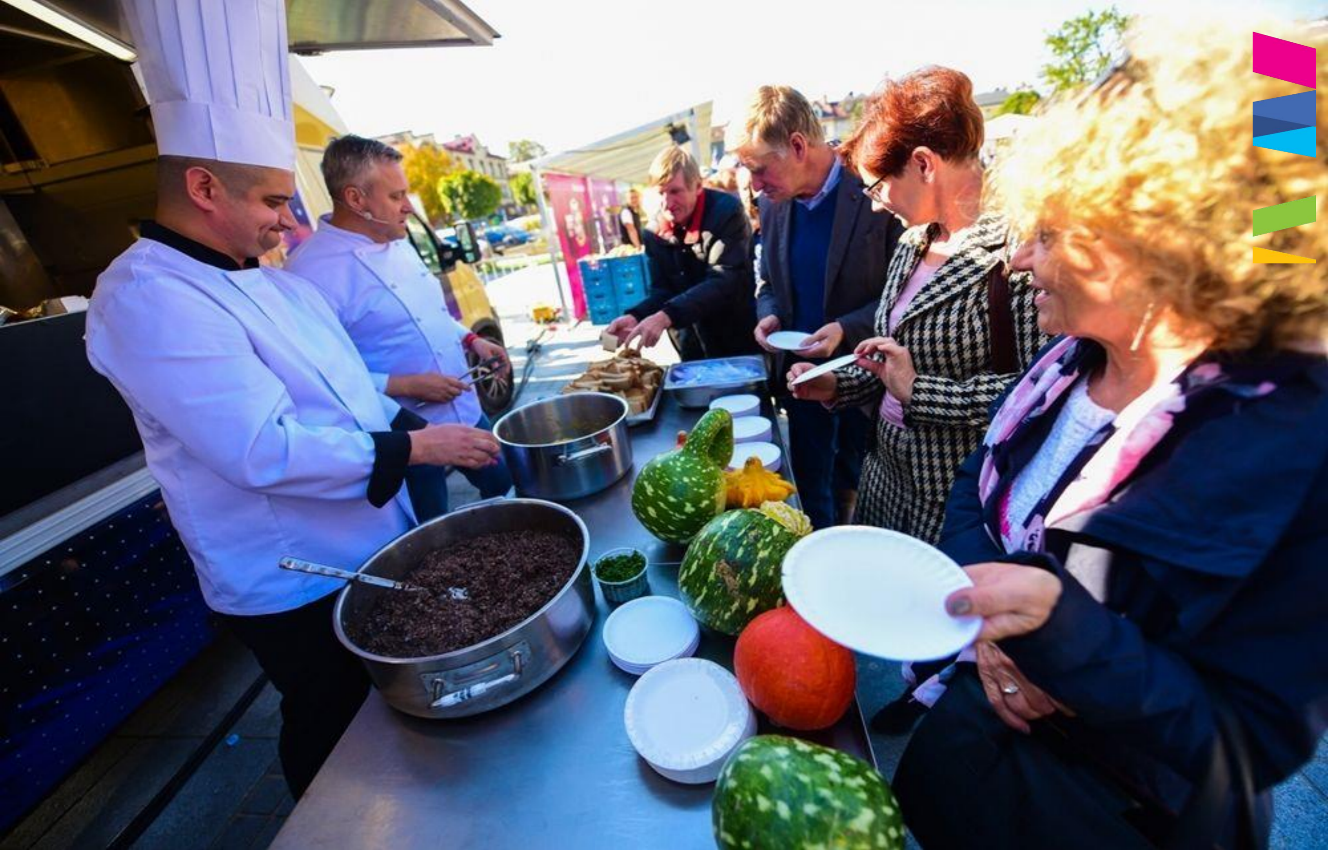
MAŁPOLSKI FESTIWAL SMAKU W NOWYM TARGU