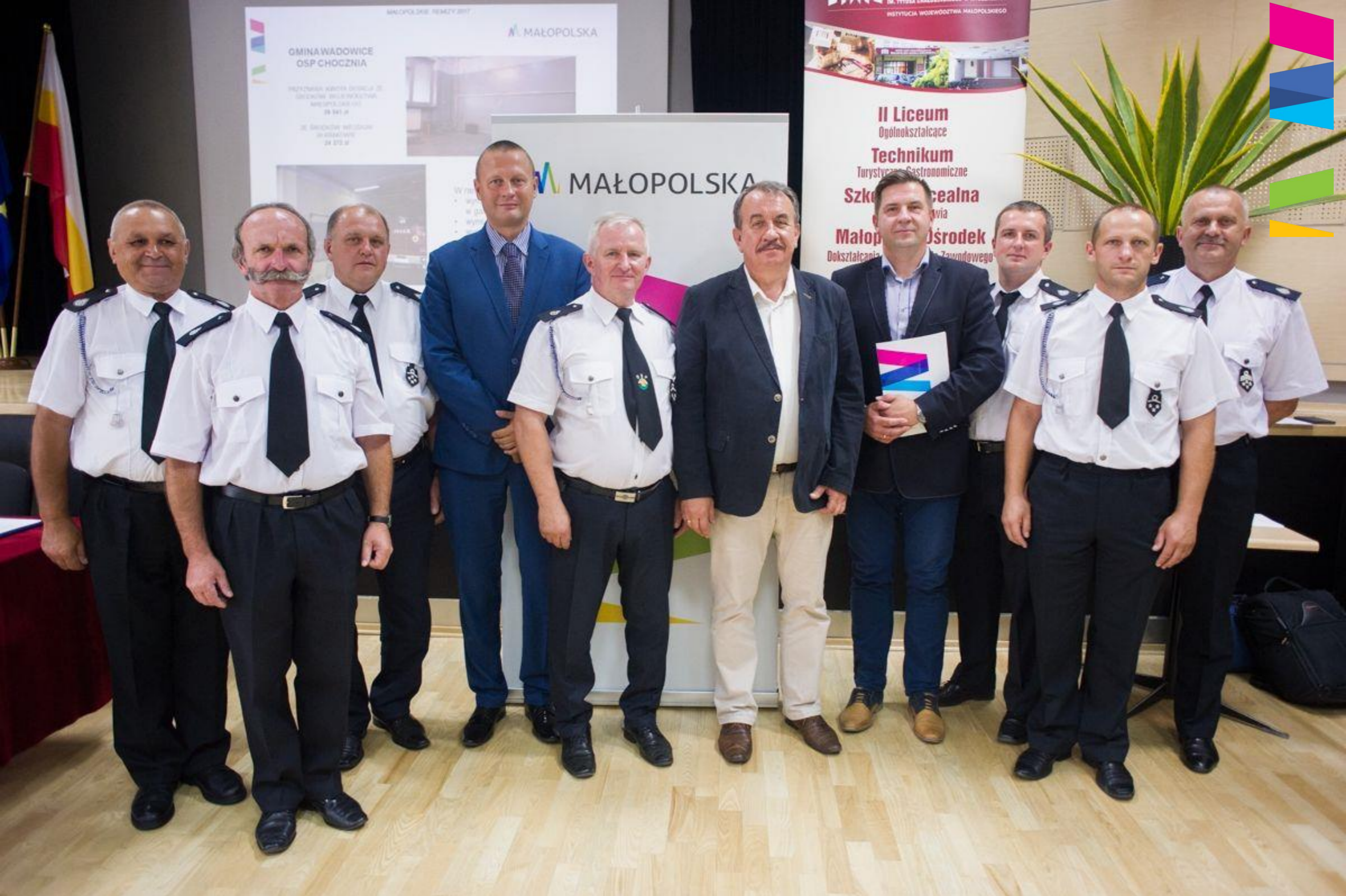
PRZEKAZANIE UMÓW – MAŁOPOLSKIE REMIZY 2017 I BEZPIECZNA MAŁOPOLSKA 2017