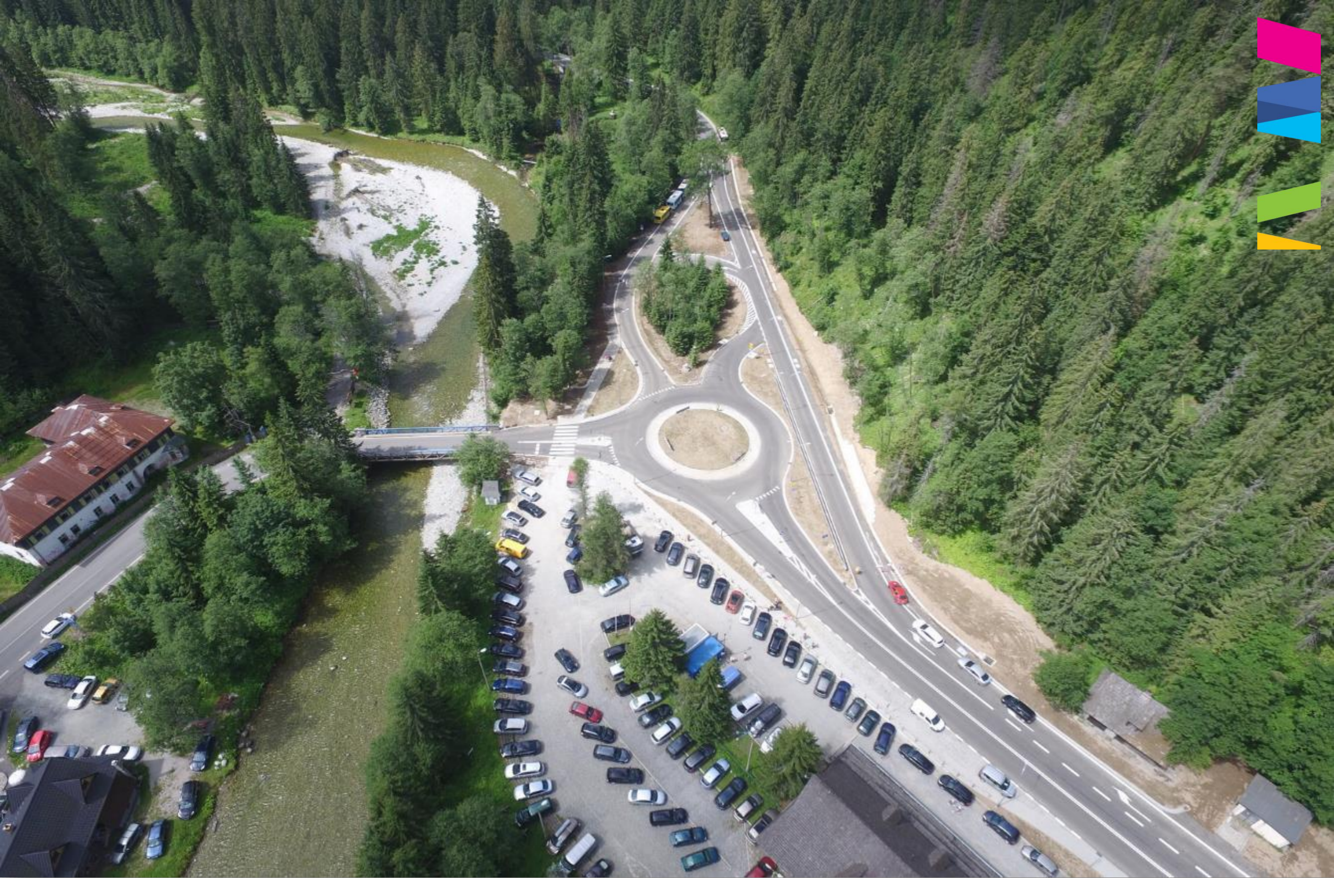
PRZEBUDOWANE SKRZYŻOWANIE NA ŁYSEJ POLANIE