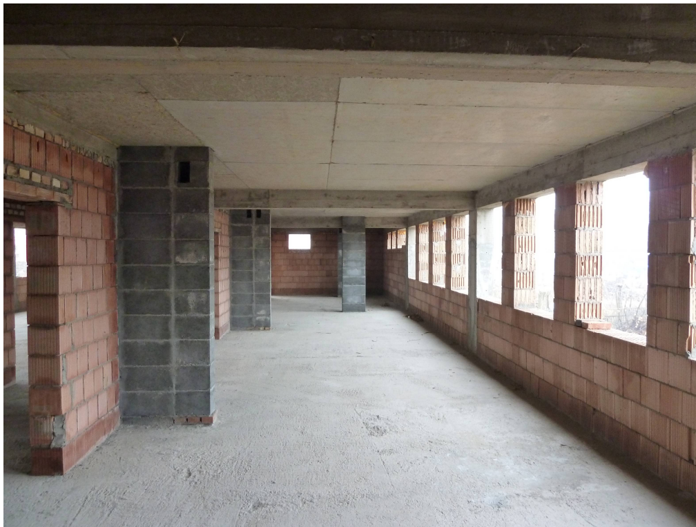
PRZESTRZEŃ BIUROWA DO ZAGOSPODAROWANIA