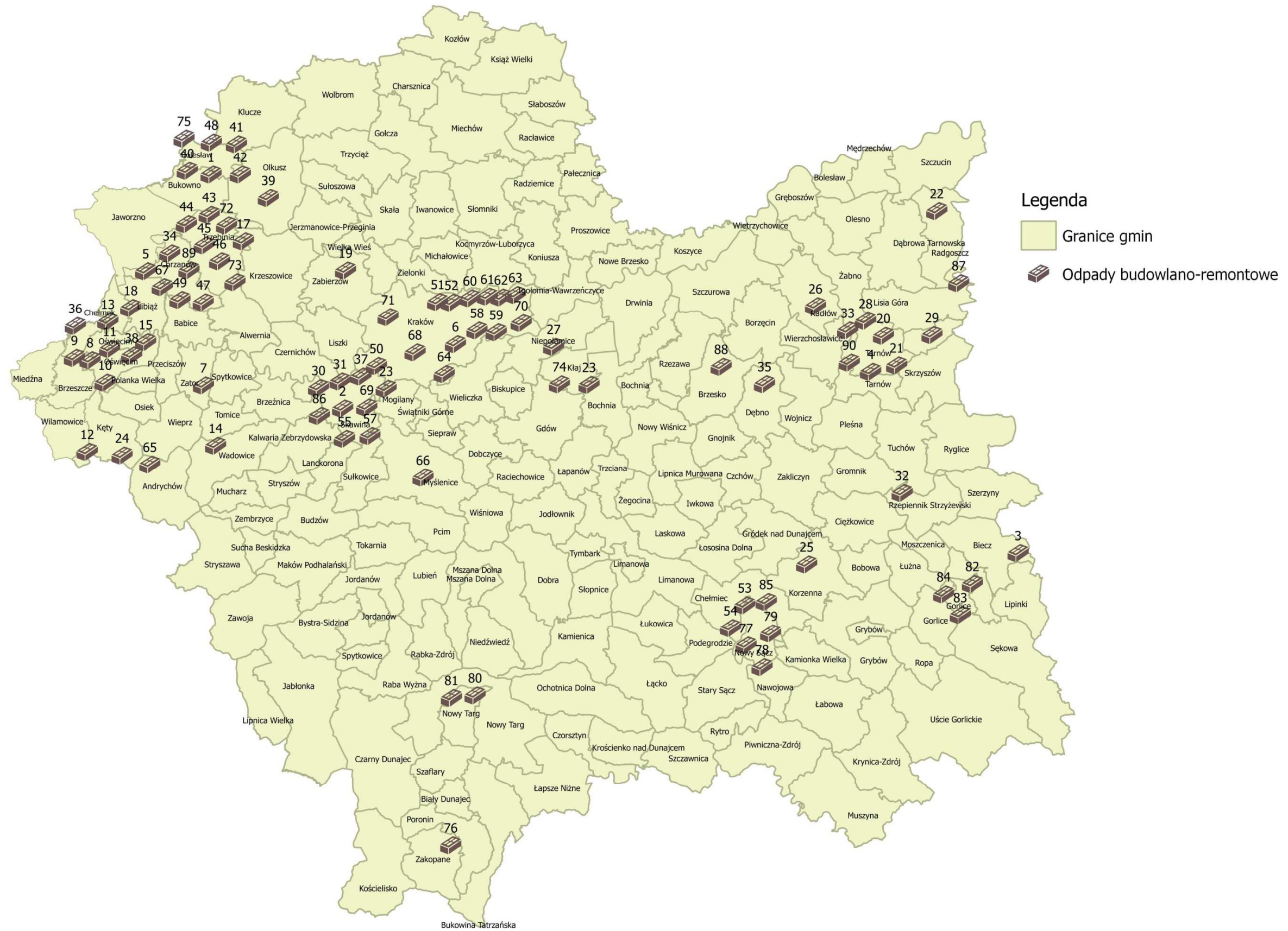
Rysunek 7: Rozmieszczenie instalacji do odzysku, w tym recyklingu odpadów budowlanych i remontowych, stan na 31.12.2014 r.