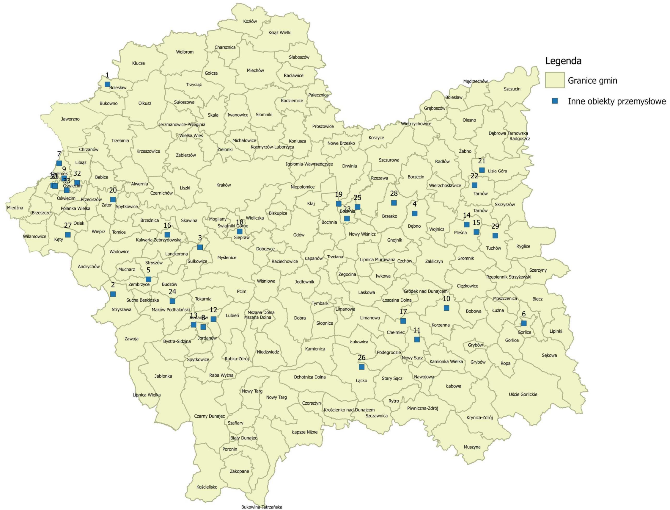
Rysunek 9: Rozmieszczenie innych obiektów przemysłowych, w tym pieców cementowych oraz obiektów energetycznego spalania paliw, stan na 31.12.2014 r.