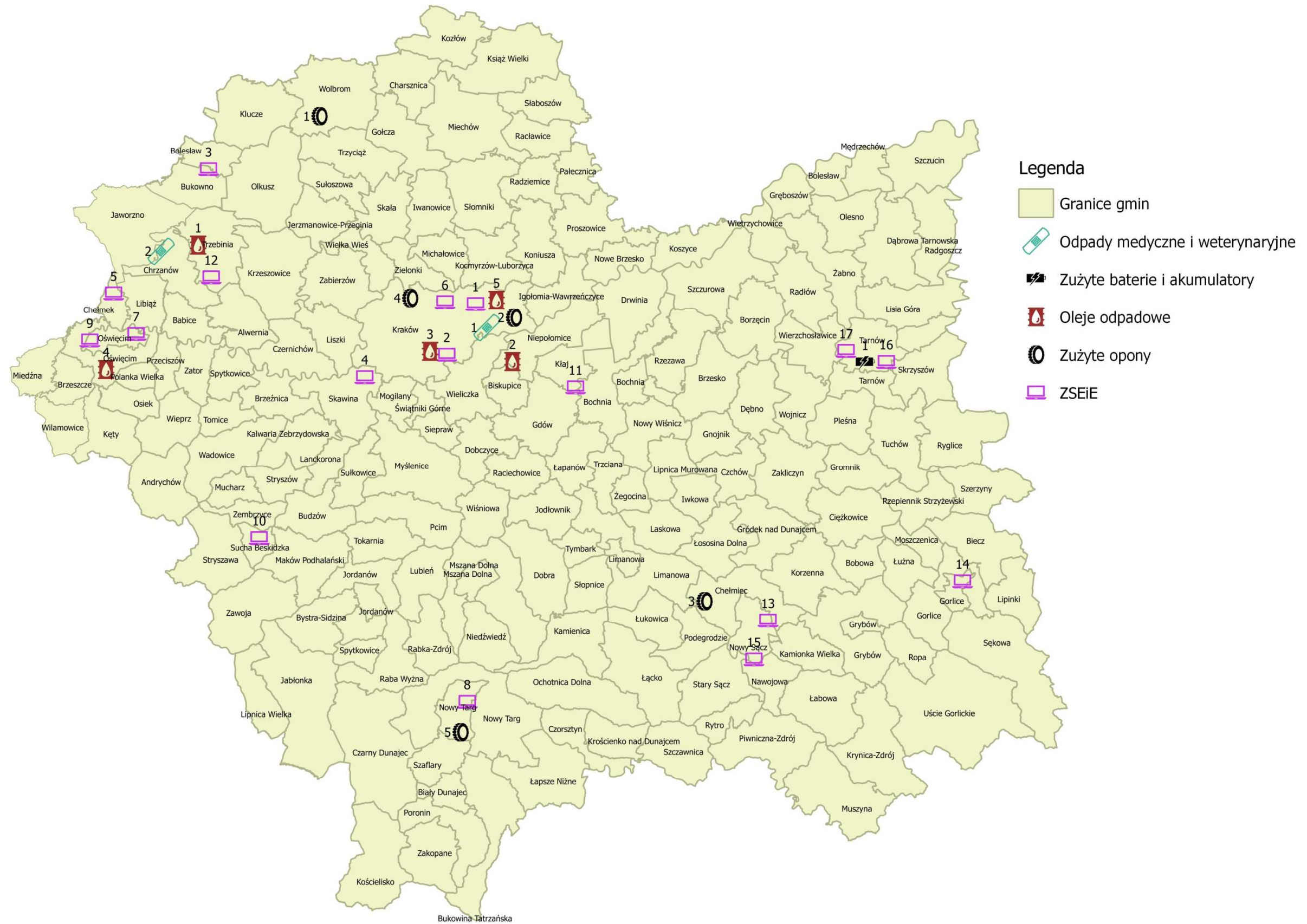
Rysunek 3: Rozmieszczenie instalacji do przetwarzania ZSEiE, zużytych baterii i akumulatorów, regeneracji olejów odpadowych, termicznego przekształcania odpadów medycznych i weterynaryjnych oraz recyklingu zużytych opon.