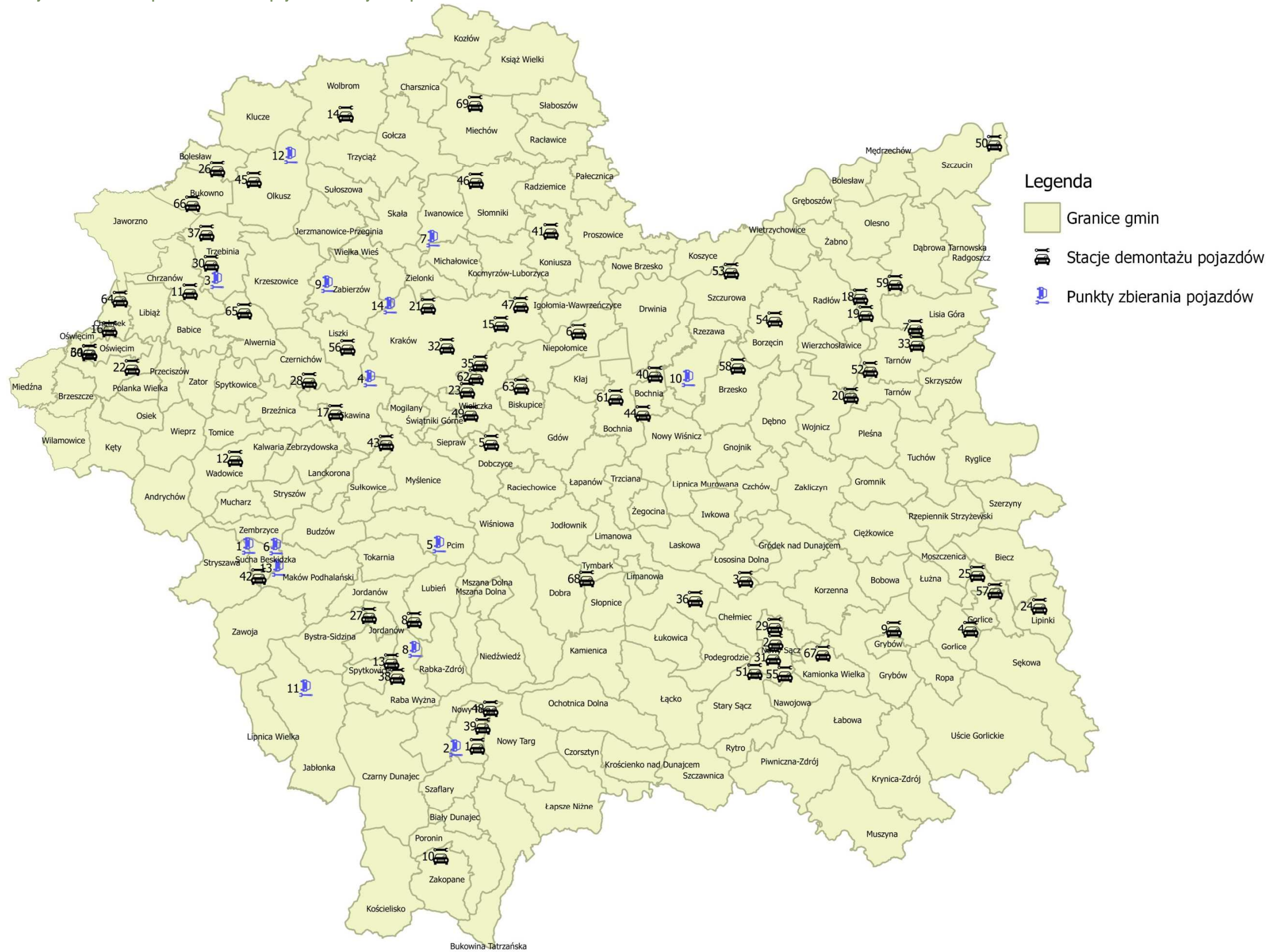
Rysunek 2: Rozmieszczenie stacji demontażu oraz punktów zbierania pojazdów w woj. Małopolskim