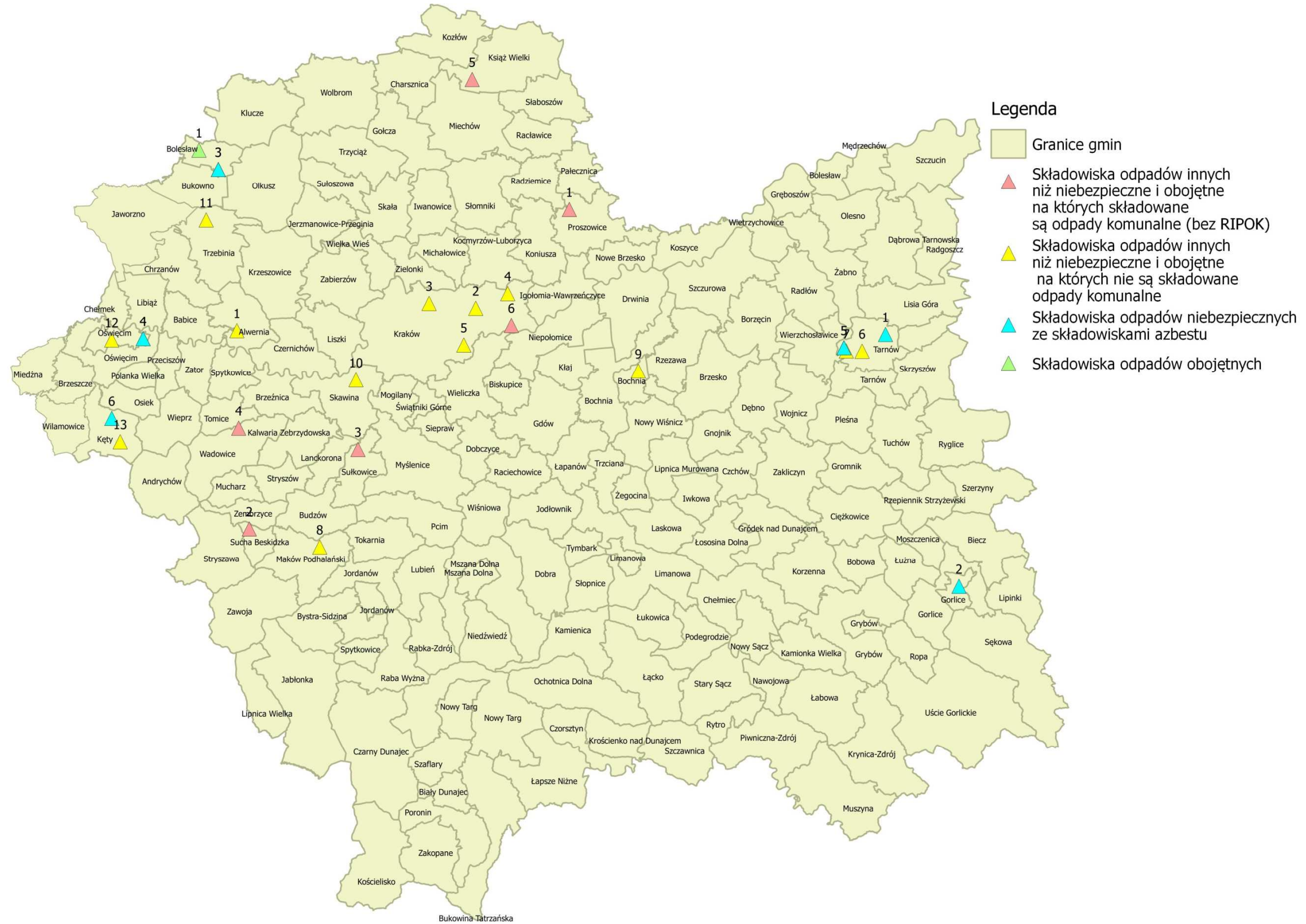
Rysunek 8: Rozmieszczenie składowisk odpadów innych niż niebezpieczne i obojętne, na których składowane są odpady komunalne (poza RIPOK), składowisk odpadów innych niż niebezpieczne i obojętne, na których nie są składowane odpady komunalne, składowisk odpadów niebezpiecznych (ze składowiskami azbestu) oraz składowisk odpadów obojętnych.