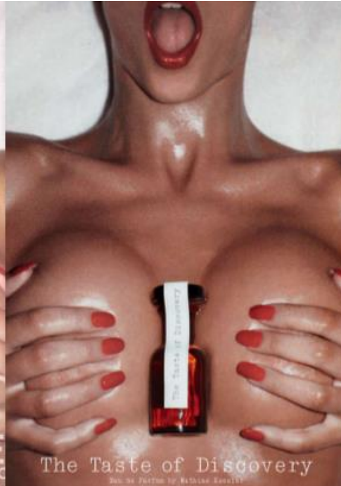
Mathias Kessler's "The Taste of Discovery"