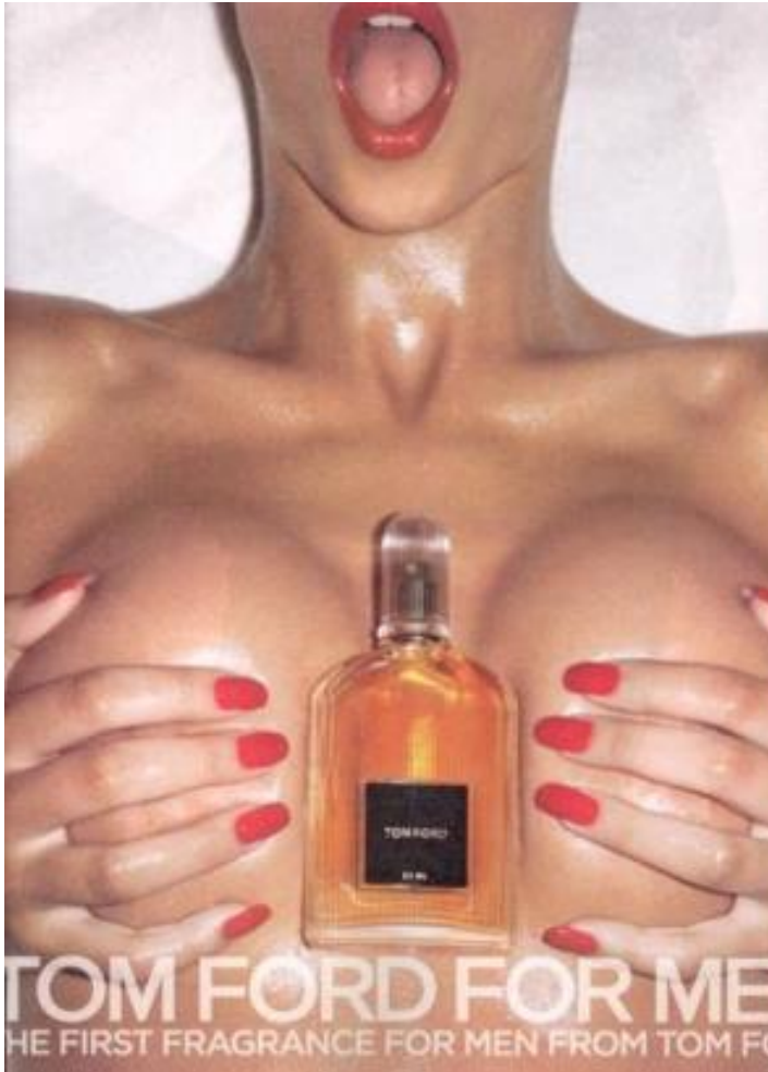
Tom Ford for Men fragrance shot by Terry Richardson