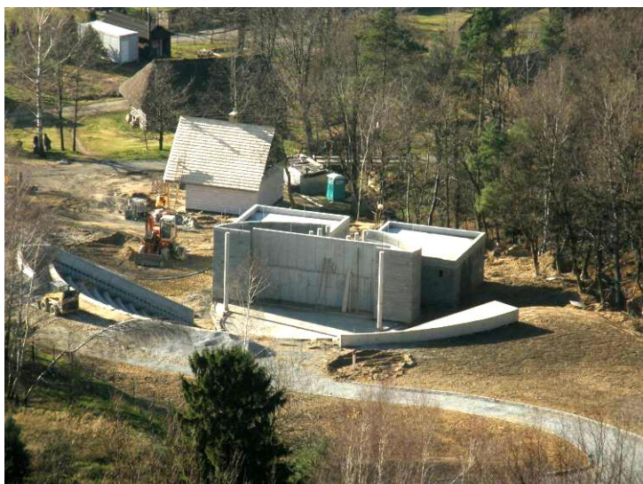
Po lewej: amfiteatr w budowie.