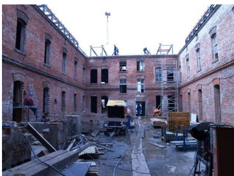
Po lewej: Muzeum Armii Krajowej podczas prac remontowych. Poniżej: przeszklony dziedziniec Muzeum Armii Krajowej.