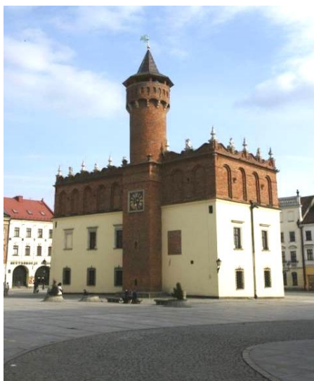
Powyżej: wyremontowany Ratusz