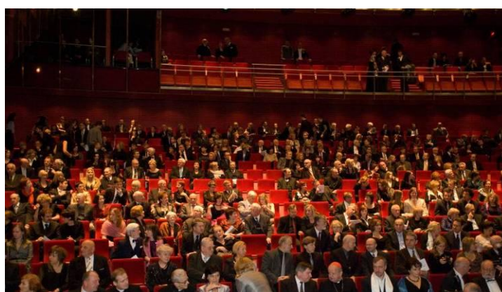
Po lewej: budynek Opery w trakcie remontu, poniżej Opera nocą. Po prawej: wnętrze sali koncertowej.