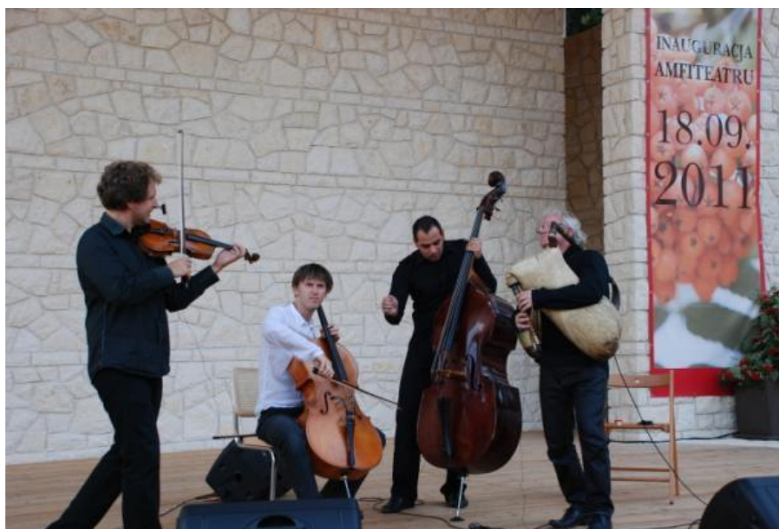
Poniżej: Koncert podczas inauguracji amfiteatru.