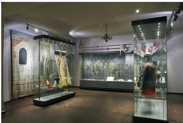
Po prawej: zmodernizowana ekspozycja stała w Ratuszu