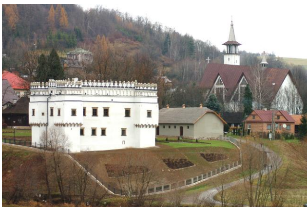
Poniżej: wyremontowany kasztel i oficyna dworska.