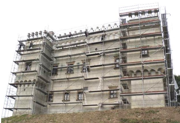
Po lewej: kasztel podczas remontu.