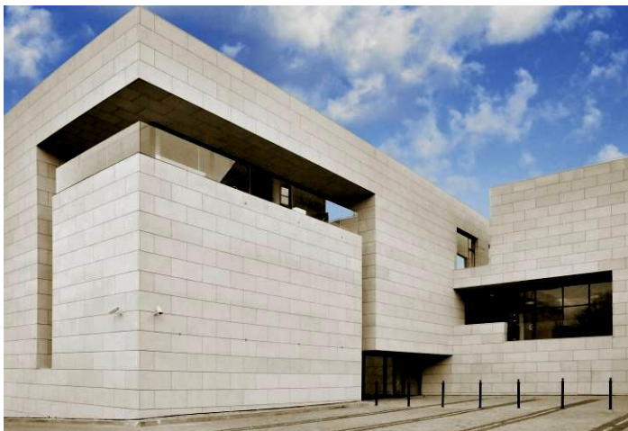
Poniżej: budynek Galerii i sala multimedialna.