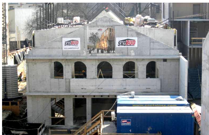
Po lewej: budowa Małopolskiego Ogrodu Sztuki. Poniżej: przeszklony dziedziniec w Małopolskim Ogródku Sztuki.