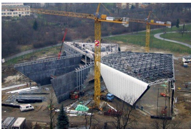
Powyżej: budowa Gmachu Głównego Muzeum Lotnictwa Polskiego, obok: stan obecny.