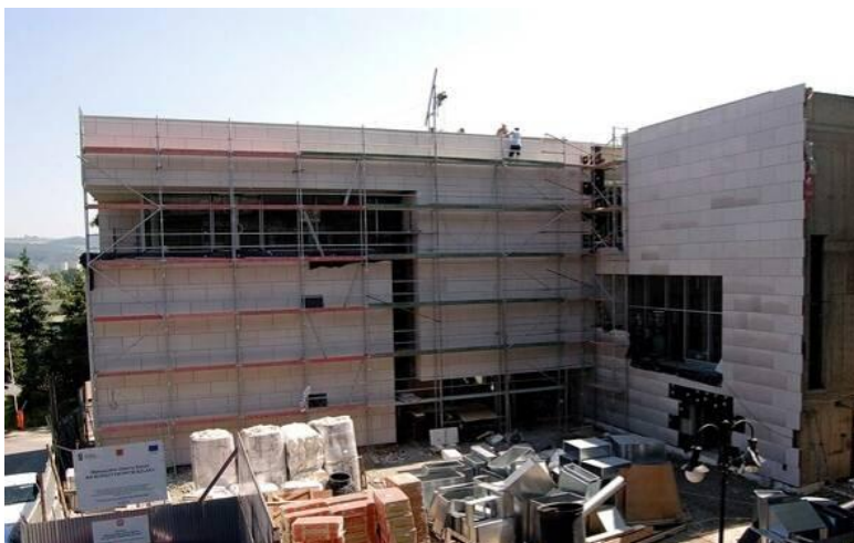
Po lewej: budowa Małopolskiej Galerii Sztuki „Na Bursztynowym Szlaku”.