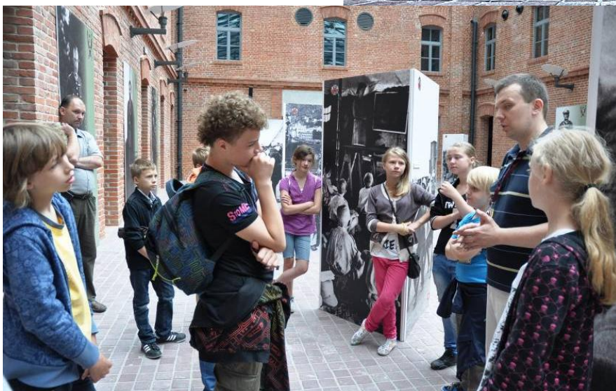
Po lewej: Zajęcia edukacyjne w ramach „Bonu Kultury”.