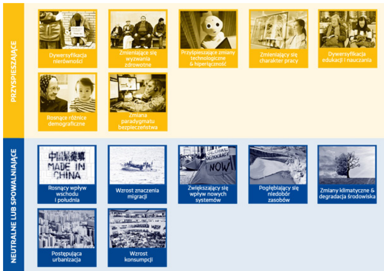
Rysunek: Potencjalne oddziaływanie COVID-19 na megatrendy

Źródło: Sprawozdanie dotyczące prognozy strategicznej 2020