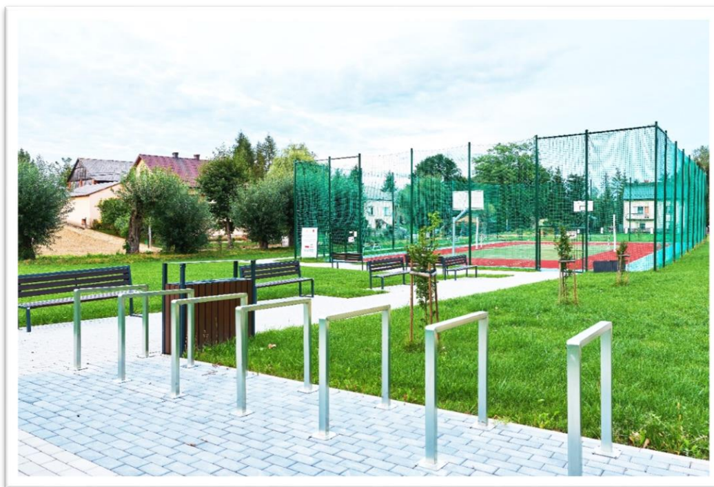
Rycina 3. Strefa sportowo-rekreacyjna w Rzeplinie.

poliuretanową do gry w koszykówkę, siatkówkę, tenis i badminton. Teren, uporządkowany i dostosowany do bezpiecznego użytkowania, wyposażono w dodatkową infrastrukturę techniczną – ławki z oparciami, kosze umożliwiające segregację odpadów i stojaki na rowery. Wykonano także nasadzenia zieleni. Na realizację tego zadania gmina otrzymała dotację z programu Małopolska infrastruktura rekreacyjno-sportowa – MIRS w perspektywie finansowej na 2020 rok. Koszt przedsięwzięcia wyniósł prawie 305 000 zł, z czego dofinansowanie wyniosło ponad 152 000 zł.