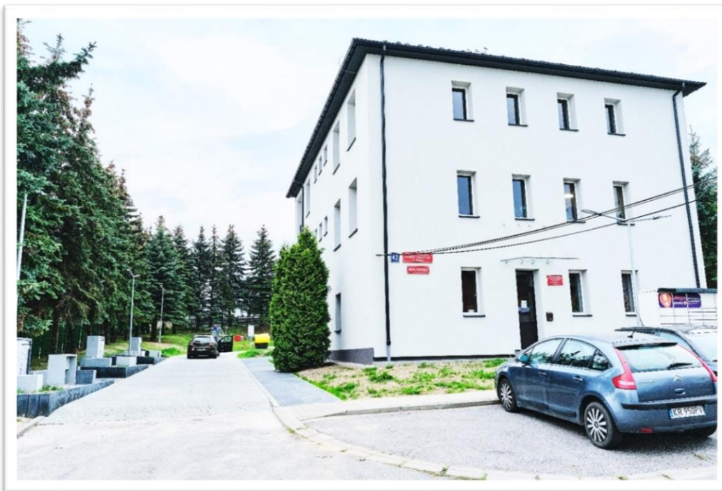
Rycina 4. Centrum kultury, sportu i rekreacji w Skale.

Warte uwagi są także projekty znajdujące się na liście dodatkowych przedsięwzięć rewitalizacyjnych. Dobrym przykładem może być zadanie polegające na poprawie warunków korzystania z oferty Centrum Kultury, Sportu i Rekreacji w Skale (CKSiR). W ramach projektu zaplanowano remont budynku wraz z jego termomodernizacją, a także – w odpowiedzi na potrzeby mieszkańców – zagospodarowanie przestrzeni w pobliżu CKSiR i utworzenie w niej kina plenerowego oraz czytelnicy na świeżym powietrzu. Prace te nie zostały jeszcze zakończone. Powyższe zadanie obejmowało także utworzenie w pobliżu CKSiR Otwartej Strefy Aktywności (OSA), czyli przestrzeni sportowo-rekreacyjnej z urządzeniami do ćwiczeń w plenerze, ławkami, koszami na śmieci, strefą urządzeń sprawnościowych i placem zabaw. Gmina na realizację tego zadania otrzymała dofinansowanie z Ministerstwa Sportu i Turystyki o wartości 50 000 zł w ramach Programu rozwoju małej infrastruktury sportowo-rekreacyjnej o charakterze wielopokoleniowym – Otwarte Strefy Aktywności (OSA) edycja 2019.