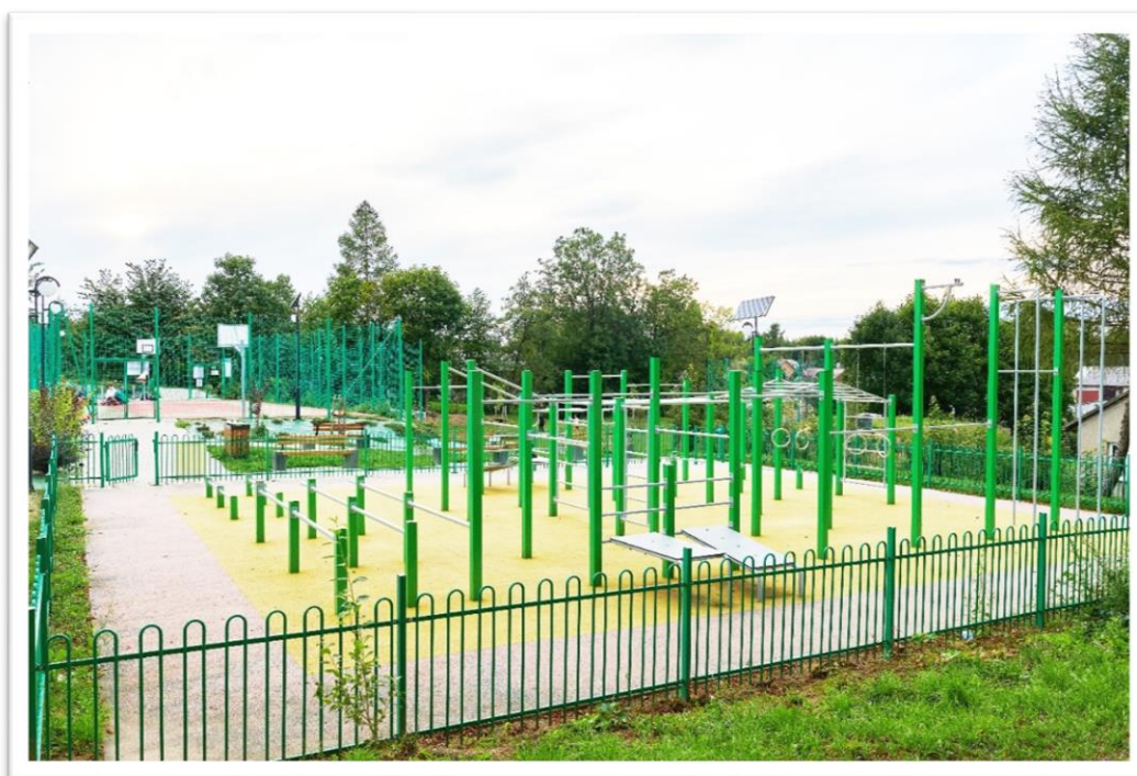
Rycina 2. Strefa sportowo-rekreacyjna w Rzeplinie.

mieszkańców nie tylko tego podobszaru. Zadanie „Modernizacja infrastruktury sportowo-rekreacyjnej w Rzeplinie w gminie Skała, poprzez budowę boiska do piłki nożnej, boiska do siatkówki i koszykówki oraz terenu rekreacyjnego wyposażonego w urządzenia typu street-workout” zostało zrealizowane w 2020 roku. Dodatkowo przestrzeń tę wyposażono w elementy małej architektury: ławki, kosze do segregacji odpadów, stojaki na rowery i lampy, wprowadzono także zieleń. Całkowity koszt realizacji zadania wyniósł prawie 600 000 zł, w czego gmina pozyskała dofinansowanie w wysokości 168 000 zł w ramach programu Małopolska infrastruktura rekreacyjno-sportowa – MIRS 2019. Bardzo ważną częścią tego przedsięwzięcia było duże zaangażowanie mieszkańców, którzy brali udział w przygotowywaniu dokumentacji projektowej, przygotowywali wizualizacje terenu i wskazywali, jak przestrzeń według nich powinna wyglądać. Po zrealizowaniu projektu i otwarciu strefy sportowo-rekreacyjnej mieszkańcy zaproponowali oddolną inicjatywę – budowę świetlicy wiejskiej. Pomysł był konsekwencją realizacji przedsięwzięcia przestrzenno-funkcjonalnego, które zyskało charakter aktywizacyjny i prospołeczny. Idąc o krok dalej, mieszkańcy zapragnęli stworzenia stałego miejsca dostosowanego do spotkań lokalnej społeczności.